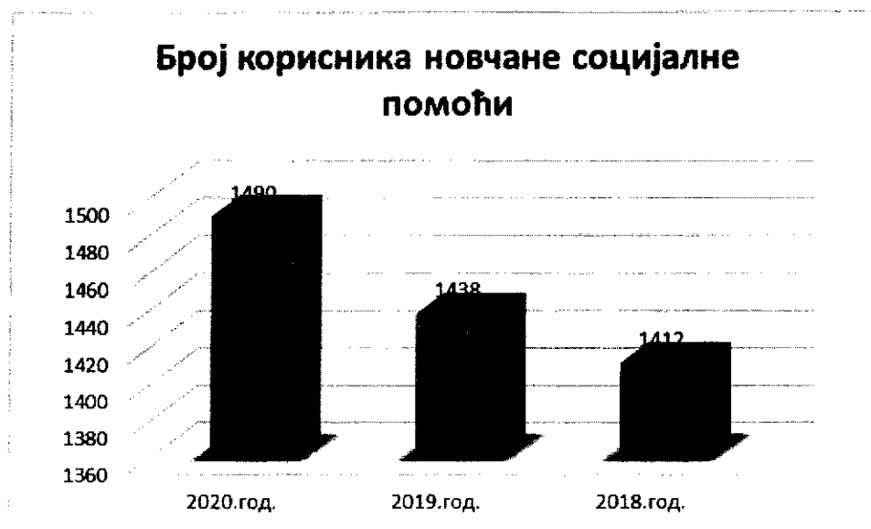
Приказ броја корисника НСП у Центру за социјални рад општине Алексинац

У 2020. години новчану социјалну помоћ примало је 1490 породица, према листингу за исплату за месец децембар 2020. године. У односу на претходне извештајне периоде број корисника се повећао ( у 2019. години укупно 1438 породица, у 2018. години 1412 породица је у децембру примало новчану социјалну помоћ).